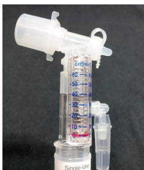
回転式圧調節バルブ