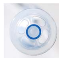
開 閉 回転式圧調節バルブ