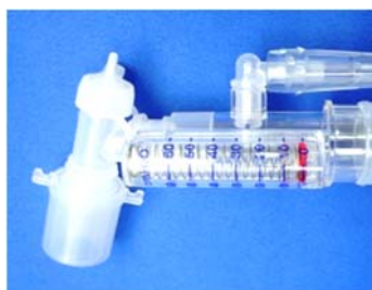
サクシヨンポート付ダブルスウィブル エルボコネクターと視認性の良い マンメーターが付いています。