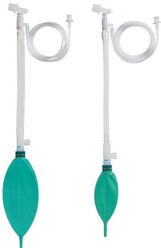
0.5Lと1Lバッグ付は15mm蛇管 2Lと3Lバッグ付は22mm蛇管